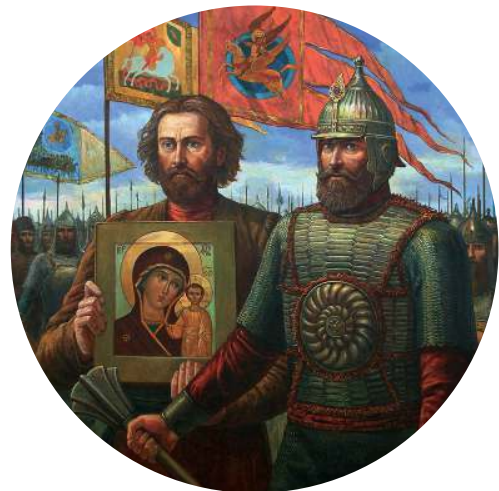
▲ Гражданин Кузьма Минин и князь Дмитрий Пожарский. 1612 г.

В начале XVII века, во время нестроений, безвластия и польской оккупации, ополчение князя Дмитрия Пожарского и Кузьмы Минина, вдохновленное посланиями святителя Гермогена, молилось перед Казанским образом Богородицы. И 22 октября 1612 года, в день празднования этой иконы по старому стилю, ополченцы штурмом взяли Китай-город, а спустя два дня освободили Кремль.