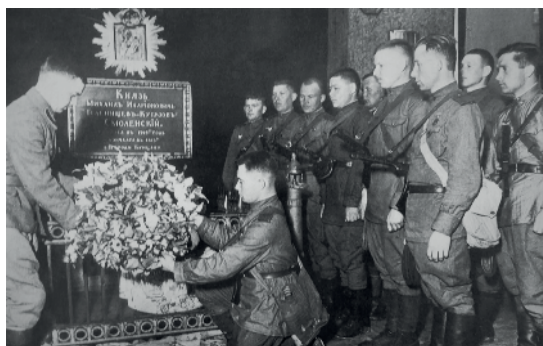
▲ Солдаты у могилы Кутузова в Казанском соборе в Ленинграде. 1943 г.

Одним из самых известных случаев войны 1812 года, связанных с помощью русским войскам Казан-